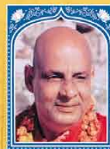
Swami Sivananda (1887 – 1963)