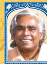
Swami Vishnudevananda (1927 – 1993)