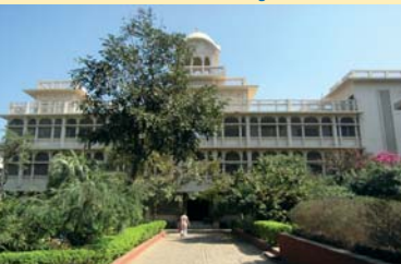
Vortrag in der Jai-Singh-Halle