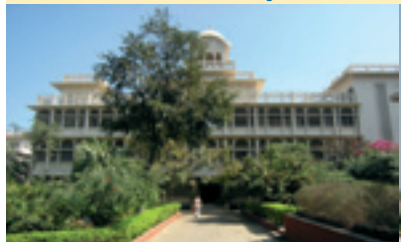
Conférence dans la salle principale de Jai Singh